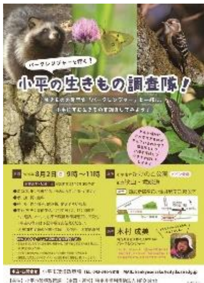
自然観察会チラシ