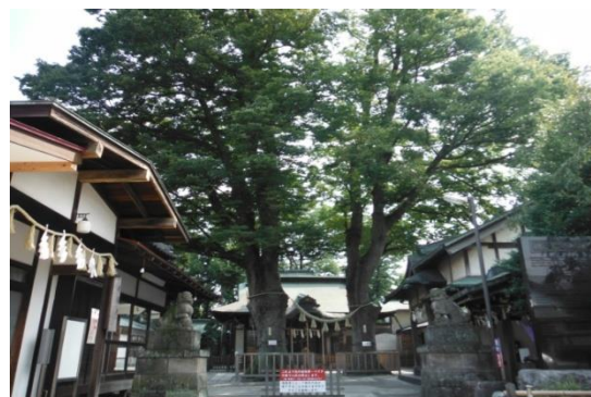
小平市指定天然記念物の熊野宮のケヤキ