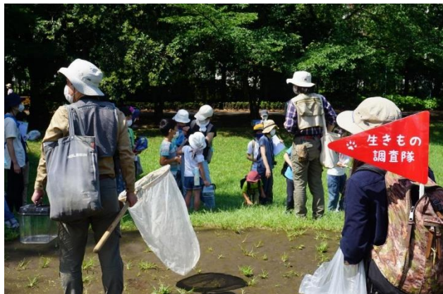
自然観察会の様子