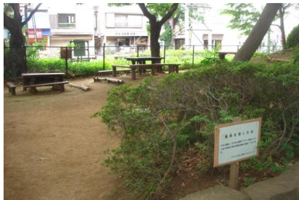
中央公園アダプト制度活動区域