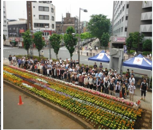
植栽後の集合写真

※令和2年度は、新型コロナウイルス感染拡大防止のため、秋の植え込みを除いてボランティアの参加を中止しました。なお、花植えは、主に市職員のみで実施しました。