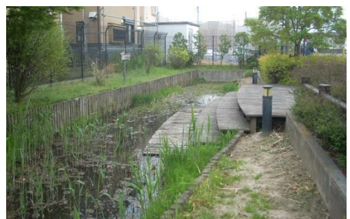
上水本町ビオトープ公園