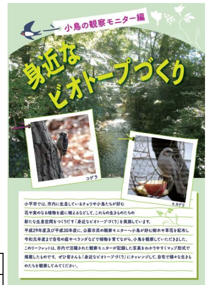
「身近なビオトープづくり ～小鳥の観察モニター編～」

令和 2 (2020) 年度については、本支援事業で苗を提供させていただいた観察モニターが記録した小鳥の写真をマップ形式で掲載した「身近なビオトープづくり～小鳥の観察モニター編～」リーフレットを作成しました。