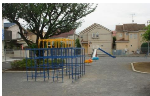
鈴木町にこにこ公園内の遊具