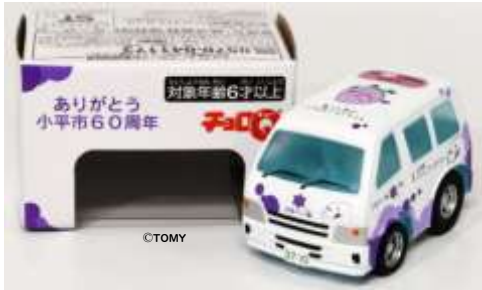
ぶるべー号デザインのチョコQ