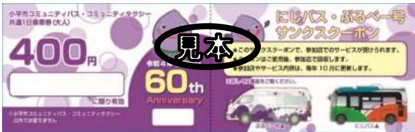
限定デザインの1日乗車券

1日乗車券は、にじバスとぶるべー号が1日乗り放題になる乗車券です。 3回以上乗るとお得で、乗り継ぎや市内めぐりなどに利用するのがおすすめです。