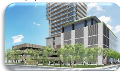
小川駅西口地区市街地再開発事業施設及び (仮称) 小川にぎわい広場イメージ図