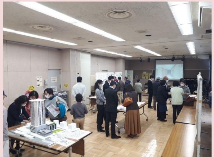
オープンハウス会場内の様子