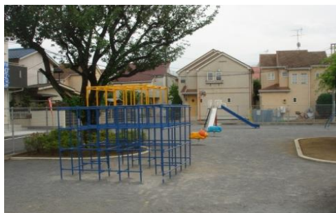
鈴木町にこにこ公園内の遊具