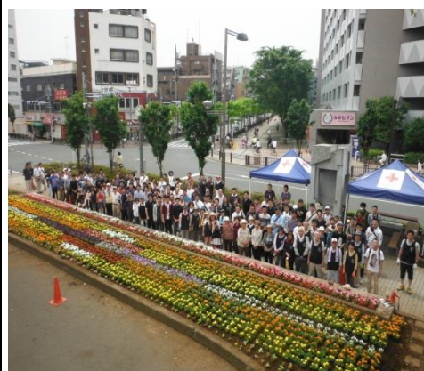
植栽後の集合写真