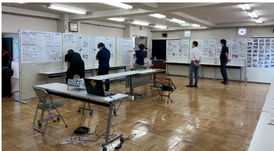
（オープンハウスの様子）

結果 トイレをきれいに、洋式にしてほしい…4 / 明るい教室にしてほしい…1 ろうかに荷物があるので通りにくい…1 / 校庭の遊具を新しくしてほしい…1 ピアノがほしい…1 / ブランコとすべり台（熱くならない）がほしい…2 うんていをそのまま残してほしい…1 / プールは絶対にいる…1 体育館を涼しくしてほしい…1 / 放課後に料理する所をつかってほしい…1 ことばの教室を自分の学校でほしい…1 学童クラブは希望者が学年問わず利用できるようにしてほしい…1 学童クラブでもタブレットを使った学習ができるように、Wi-Fi環境を整えてほしい…1 学童クラブ入会対象外の子どもが長期休暇中に利用できる安全な居場所をつかってほしい…1