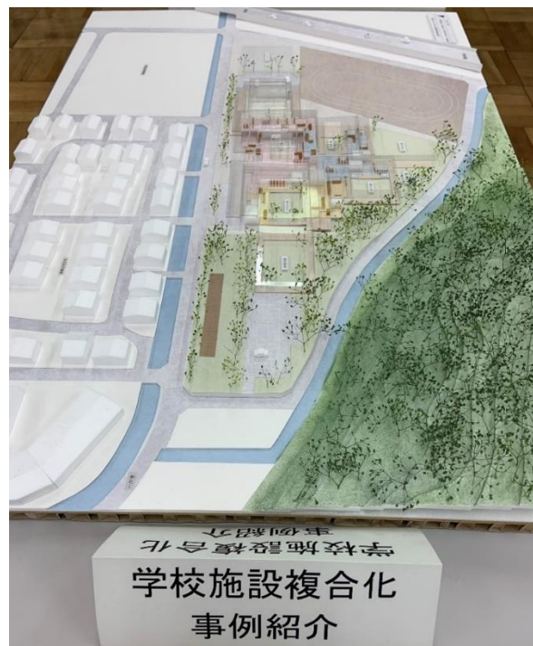
(公募によって提供された事例模型)