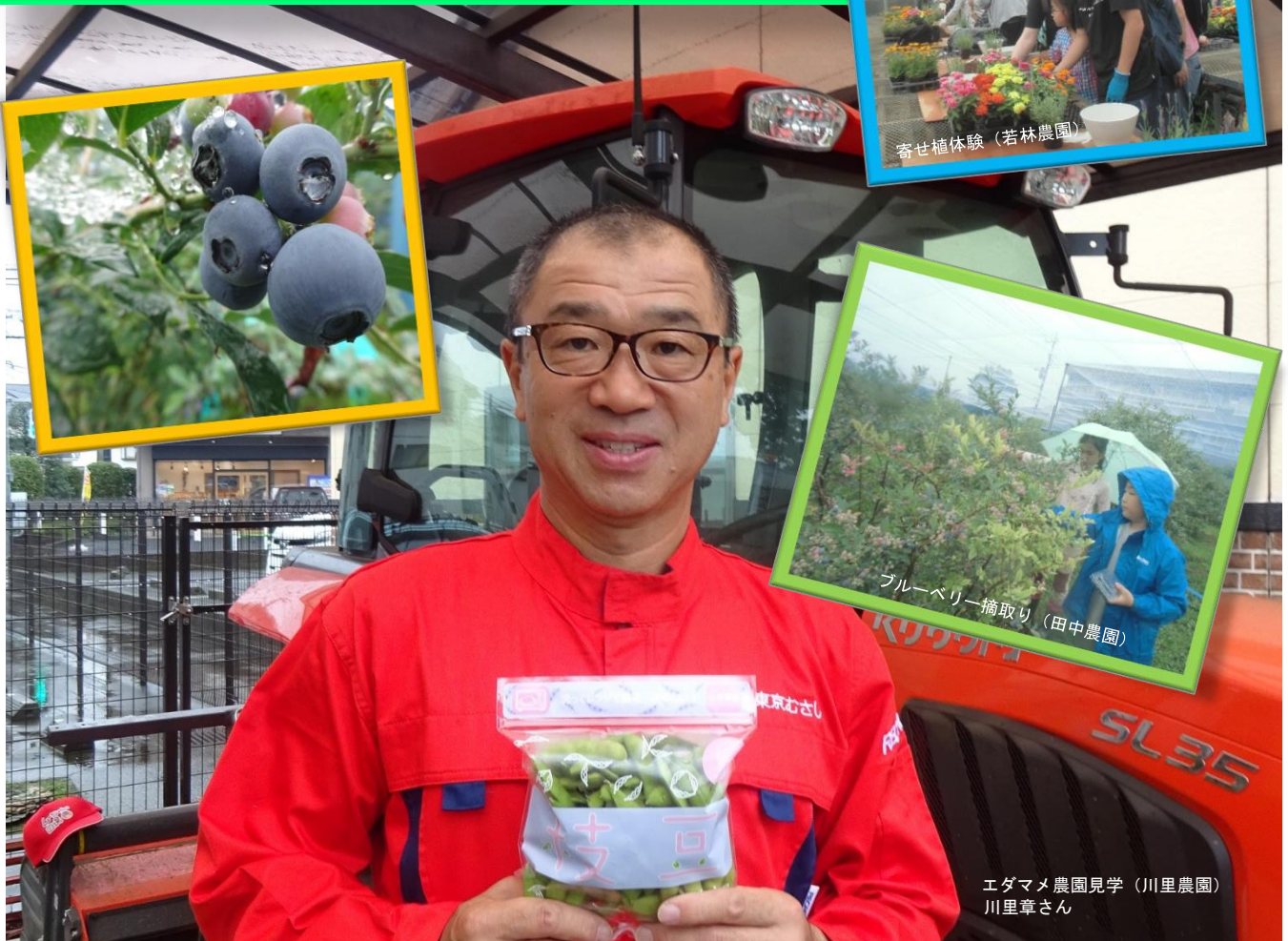
寄せ植え体験(若林農園)