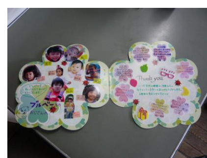
子ども達の写真付きのメッセージカード。それぞれの子ども達からのメッセージが綴られています。

昨年12月9日、ぶるべー号栄町ルート、小川駅入口停留所で、「小川・栄町コミュニティバスの会」のメンバーから乗務員に、サンタクロースの衣装がプレゼントされました。会のメンバーは、「地域のお年寄りから子どもまで、喜んでくれるのではないかと」と発案し、自ら各方面と調整