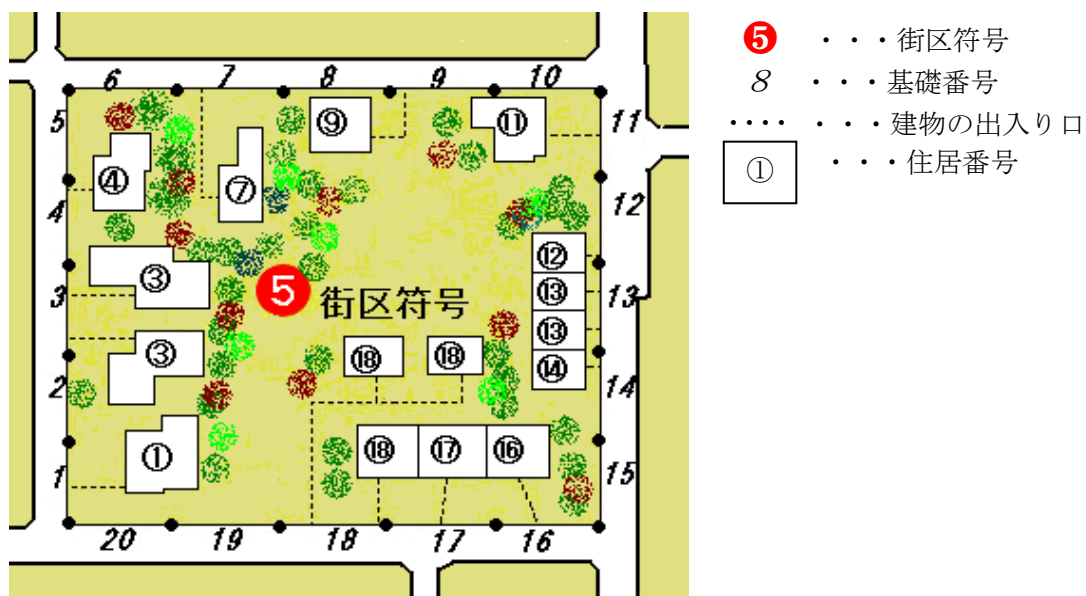
図2 住居番号の付け方