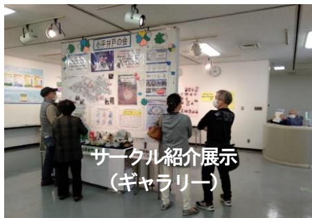
サークル紹介展示 (ギャラリー)