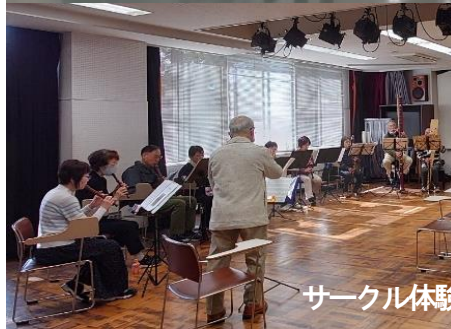
サークル体験会 (各部屋)