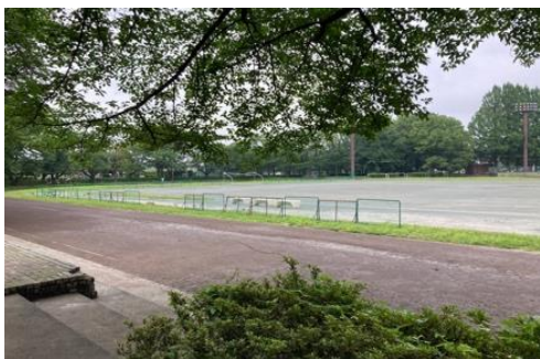
普段の鷹の台駅側のグラウンドと陸上トラック

競技場トラックの外側には樹木や植え込みがあり、さらに公園通路の外側にも樹木があります。新たな照明設備を設置する場合、中央公園内の樹木や植え込みに影響が生じるおそれがあります。