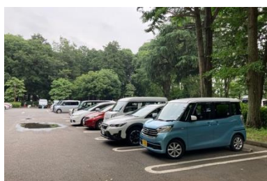
写真⑤ 駐車場の状況