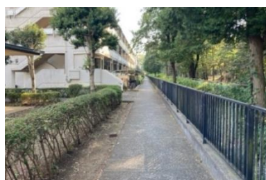
写真⑧ 都営住宅との間の通路