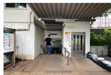
写真③ 鷹の台駅との接続状況