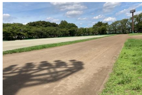
普段の野球場エリア(外野)にかかる陸上トラック