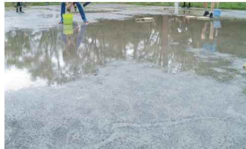
雨天後のグラウンドの状況