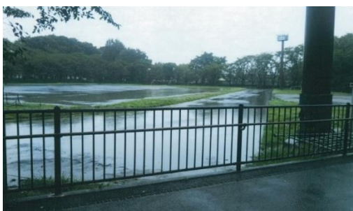
雨天時のグラウンドと陸上トラックの状況