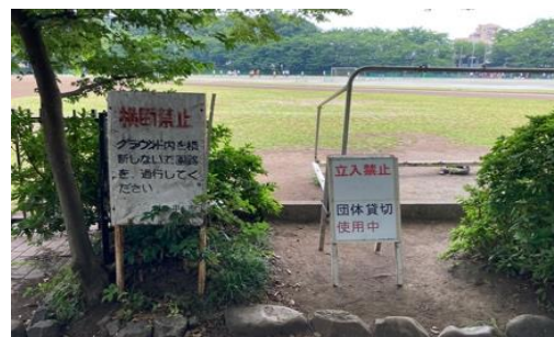
侵入防止対策の状況