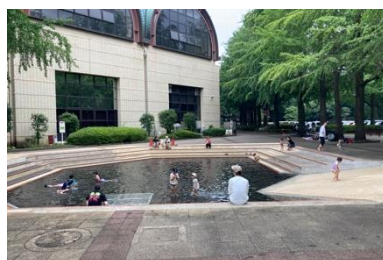
写真② じゃぶじゃぶ池周辺の状況