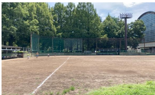
バックネットと照明の状況