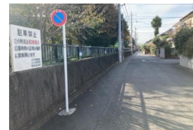
写真⑨ 中央公園北側通路の状況