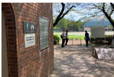
写真① トイレと入り口の状況