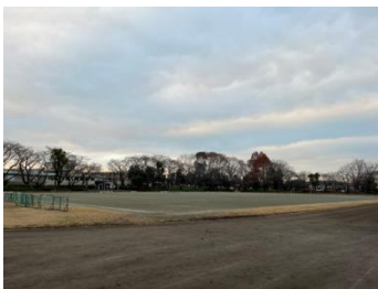
サッカー等実施エリアと陸上トラック