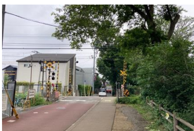
写真⑦ 敷地南側の道路状況