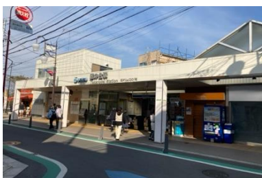
写真④ 鷹の台駅の状況